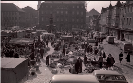
Fotografie des Marktes von Hilde Stümpel aus dem Jahr 1963