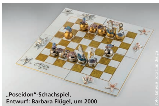
„Poseidon“-Schachspiel, Entwurf: Barbara Flügel, um 2000